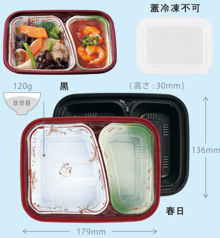
T-18-14-B (春日) T-18-14-B (黒)