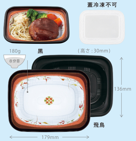
T-18-14-C (飛鳥) T-18-14-C (黒)