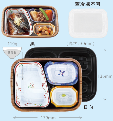
T-18-14-A (日向) T-18-14-A (黒)